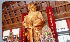
วัดแซงทมิว