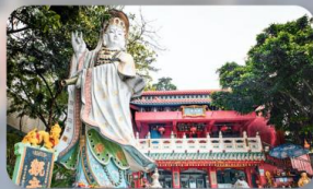
เจ้าแม่กวนอิมรีฟลส์เบย์