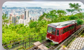
รถรางพิคแตรม